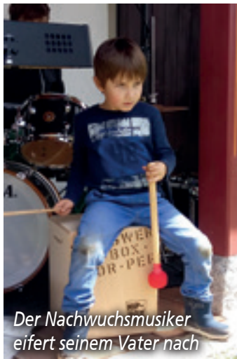
Der Nachwuchsmusiker eifert seinem Vater nach