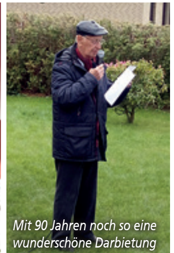
Mit 90 Jahren noch so eine wunderschöne Darbietung