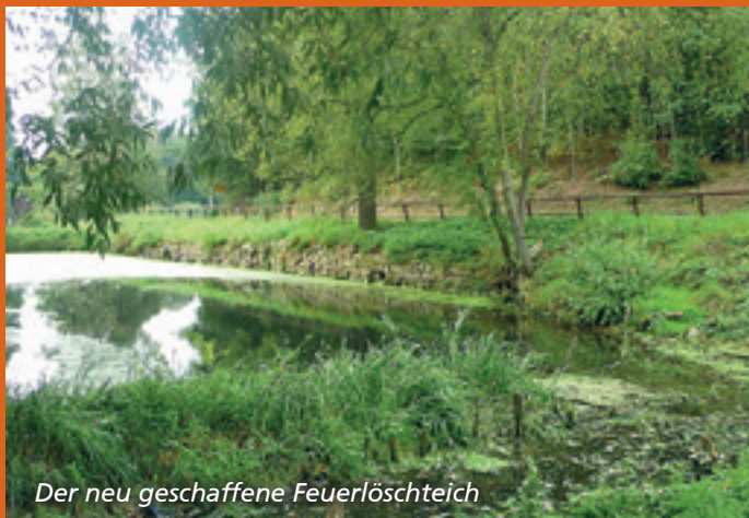
Der neu geschaffene Feuerlöschteich