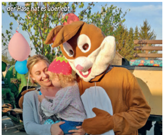
der Hase hat es überlebt...

Spenden für die Unkosten dieses Kantatengottesdienstes werden gern entgegengenommen Konto des Ev.-luth. Pfarramtes Gaußig: DE12 8555 0000 1000 0035 62 Verwendungszweck: Kirchenmusik