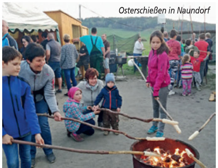
Osterschießen in Naundorf